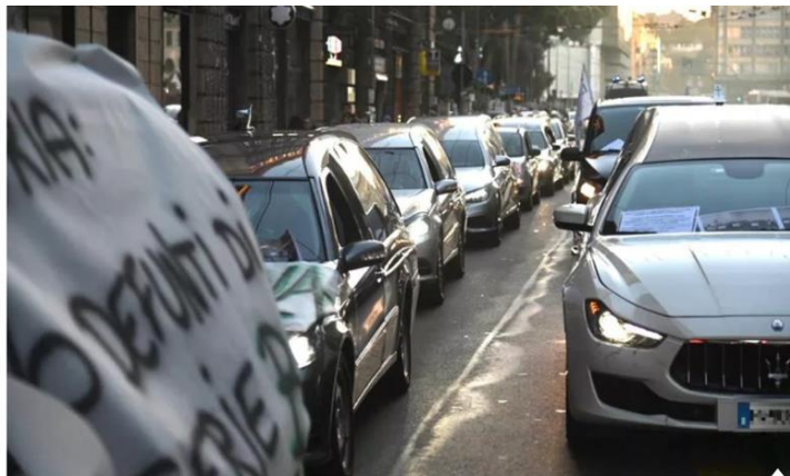
Genova, il corteo funebre di protesta